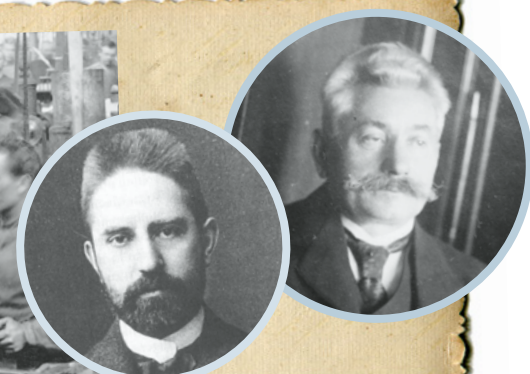
Die Arbeitsbedingungen selbst regeln, ohne staatliche Einmischung: Das ist die Kernidee der Tarifpartnerschaft, begründet durch Hugo Stinnes (kleines Bild links) und Carl Legien (rechts).