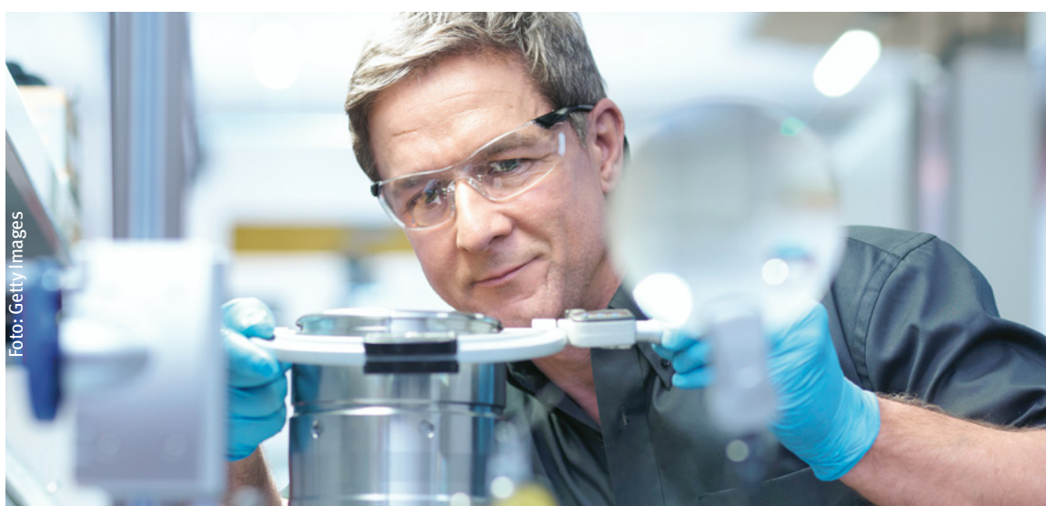
Fast jeder zehnte Erwerbstätige in Deutschland ist bei einem M+E-Unternehmen beschäftigt.

Anhaltendes Wachstum, steigende Beschäftigung: Die Metall- und Elektro-Industrie ist seit zehn Jahren auf Erfolgskurs. Alles bestens also? Leider nicht, zeigt der aktuelle M+E-Strukturbericht. Denn im Ländervergleich rutschte der Standort Deutschland deutlich ab,